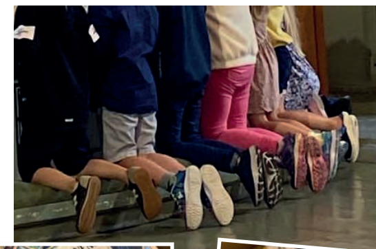
Siunausta koulutielle Inkoon kirkossa 9.8.2021, lapset saivat lahjaksi ikioman hienon lasten raamatun.