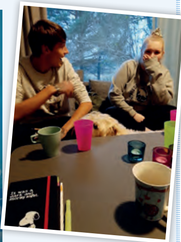
Ungdomshuset har detta år piffats upp med en ny väggmålning och nya möbler för att öka trivselen – och ungdomarna trivs!