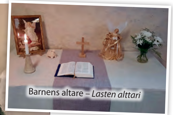
Barnens altare – Lasten alttari