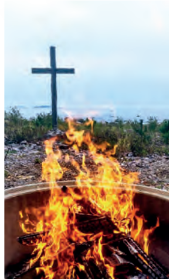
Brasan på Stora Fagerö Nuotio Stora Fagerössä.