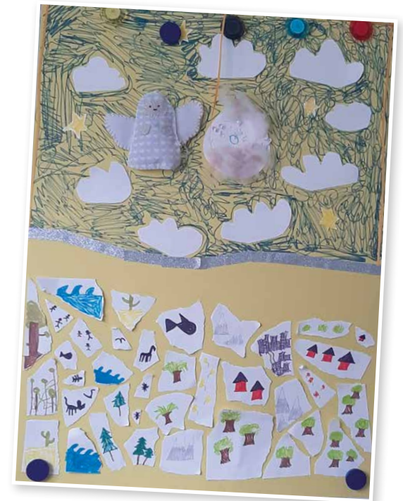
Den finska kvällsgruppens arbete. / Suomenkielisen iltaryhmän työ "Jumala".