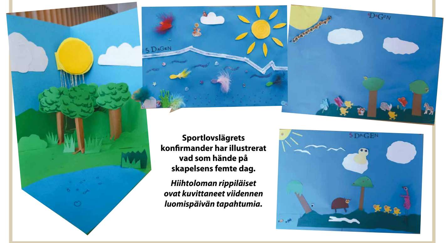
Sportlovslägrets konfirmander har illustrerat vad som händer på skapelsens femte dag.