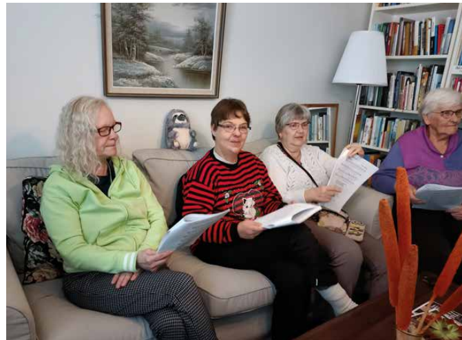
Vändagskaffe 14.2 i diakonins vardagsrum på Strandvägen 11. Ystävänpäiväkahvit 14.2 diakonian olohuoneella Rantatiellä 11.