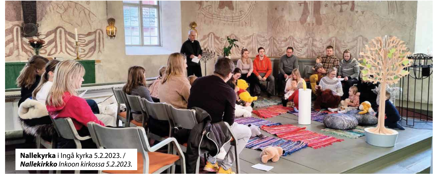
Nallekyrka i Ingå kyrka 5.2.2023. / Nallekirkko Inkoon kirkossa 5.2.2023.

Kirkon pilareiden väri on kauan ollut hyvin kulunut mutta tammi-kuussa kirkon pilarit nyt maalattiin Bilto Oy:n toimesta. Seuraavalla kerralla kun käyt kirkossa, muista katsoa maalattuja pilareita!