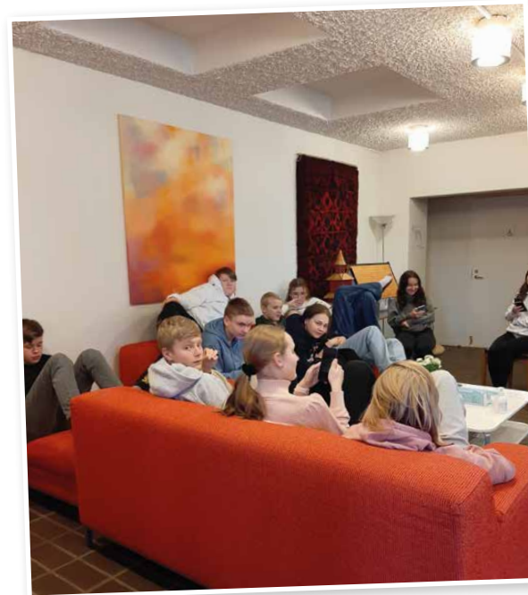
Den svenska kvällsgruppen på paus i församlingshemets röda soffa. / Ruotsinkielinen iltaryhmä paussilla seurakuntakodin punaisella sohvalla.