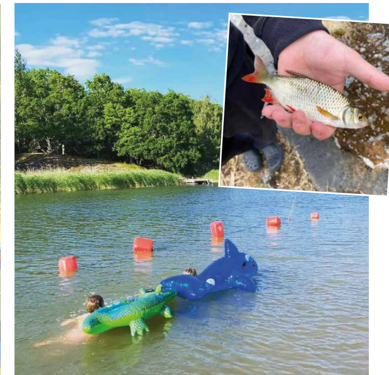
På Rövass hölls tre tätläger. Bilderna är från samma läger. / Rövakessa pidettiin kolme telttaleiriä. Kuvat samasta leiristä.

Årets församlingsutfärd hölls 7.6 och gick till Somero. Vi bekantade oss bl.a. med Hovila gård och dess museum. / Vuoden kesäretki pidettiin 7.6. ja Somero oli kohteemme. Tutustuttiin mm. Hovilan kartanoon.