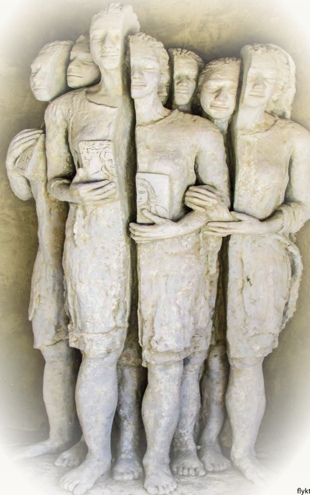
Skulptur föreställande flyktingar. / Pakolaisia edustava veistos. Bild: Pixabay

Ömsesidig respekt är en gåva och en styrka, som förvandlar samhället till en gemenskap. Tyvärr är respekt någonting som i dagens situation ofta tycks vara svårt att finna. Det är ändå någonting som kyrkan borde stå och kämpa för. Ett bra sätt att börja med är att stå på den svagares sida i samhället och att aktivt påverka och arbeta där det behövs stöd och hjälp. Att se och förstå den som är förtryckt eller i nöd och göra det klart att det inte kan fortsätta så i vårt samhälle! Vi är alla värdefulla i Guds ögon. □