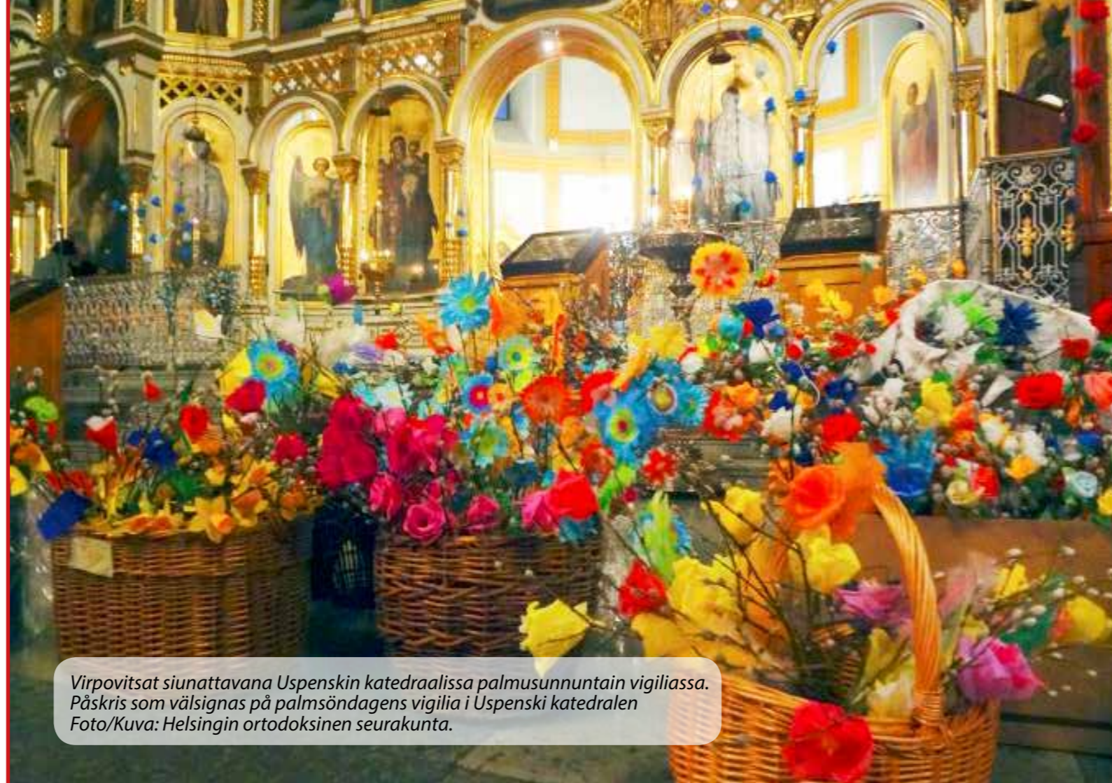
Virpovitsat siunattavana Uspenskin katedraalissa palmusunnuntain vigiliassa. Påskris som välsignas på palmsöndagens vigilia i Uspenski katedralen

Kristus dog på korset, och det normala livet upphörde. Världen höll död och mörker för viktigare än liv och ljus. Kristi heliga uppståndelse innebar ett slut för denna värl-